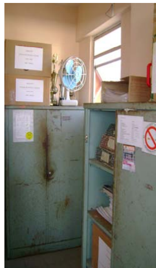
Fig. 3 e 4. Textos guardados em caixas e arquivos

Partindo do que pude constatar neste local de trabalho, consegui depreender a presença de dois textos xerografados e dois calendários anuais (um dos quais contendo a imagem de Nossa Senhora) afixados na parede acima do birô pertencente ao sujeito A (fig. 5). Segundo ele, um dos textos intitulado “A Loja de Deus” (fig. 6), cujo autor é desconhecido, foi veiculado pela internet e busca passar uma mensagem de cunho religioso. Trata-se de um pequeno diálogo entre um comprador e um anjo sobre as coisas que são vendidas no local (perdão, fé, felicidade e salvação); o outro (fig. 7), cujo título é “Para elevar a auto-estima é preciso...entrar no clima”, foi entregue em um curso sobre relações humanas 12 , do qual os funcionários do DPP participaram, juntamente com os demais funcionários da Secretaria de Administração. O texto é composto por algumas gravuras relacionadas a frases que dão dicas de como atingir a auto-estima.