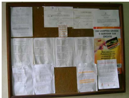
Fig. 8 O quadro de avisos da sala de entrada do DLU no mês de agosto de 2007

O material escrito observado no DLU se encontra exposto em um quadro de avisos afixado na parede (Fig. 8, abaixo) da sala de entrada. Prioritariamente, os textos têm a função de informar os trabalhadores sobre questões práticas do seu cotidiano, e de organizar o funcionamento do setor. Estes textos, apresentados na foto a seguir, em sua maioria, são xerografados e aparecem sob a forma de avisos sobre assuntos variados (escala de férias para o ano de 2007, horário de entrega do vale-transporte, horário de chegada ao local de trabalho para os funcionários do turno da noite, horário de assinar a folha de ponto para os funcionários efetivos e prestadores de serviços); texto onde são expostos alguns artigos das leis Nº 3254/1996 e Nº 4519/2007 sobre a legislação do programa de vale-transporte para servidores públicos municipais (no final da folha há uma nota escrita à mão sobre os documentos necessários para se inscrever no referido programa); cartaz de propaganda sobre o pagamento do ano de 2007, calendário de pagamento anual, texto informativo sobre o Programa Permanente de Saúde do Servidor e cópia de um requerimento de um vereador da cidade ao Presidente da Câmara de Vereadores, solicitando uma homenagem aos garis de Campina Grande.