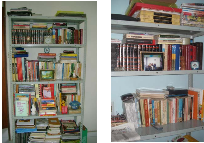
Fig. 9 e 10 Estante da casa do sujeito A

Observe-se que os livros estão arrumados diferentemente nas prateleiras da estante, uma vez que estas fotografias foram registradas em datas diferentes da pesquisa: a primeira foi tirada em 04 de dezembro de 2006, e a segunda, em 26 de julho de 2007. Não posso afirmar se nos dois momentos em que visitei a casa do sujeito A, sua estante estava arrumada porque ele sabia das minhas visitas e quis prepará-la para compor o cenário de investigação ou se estava arrumada espontaneamente. Nesse sentido, são oportunas as palavras de Goffman (1975) quando diz que “na vida cotidiana, por certo, há uma clara compreensão de que as primeiras impressões são importantes”. Assim, os primeiros encontros tornam-se imperiosos para a definição das interações que estão por vir.