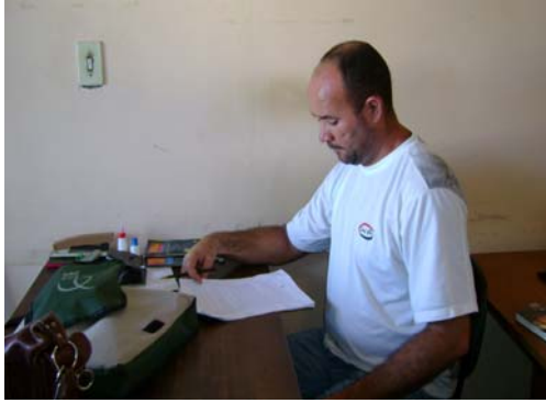
Fig. 1 O sujeito A em seu local de trabalho