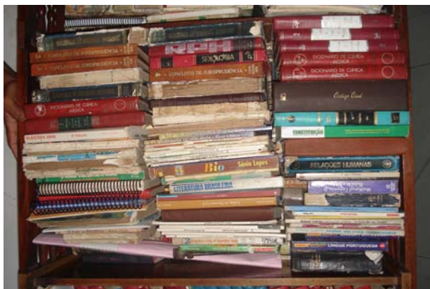
Fig. 13 Uma das prateleiras da estante da sala da casa do sujeito B

Comparando o material impresso, em circulação na casa do sujeito B, com o encontrado na casa do sujeito A, pude notar que no ambiente de B, há um número bem mais expressivo de material escrito compondo o cenário (livros, revistas, calendários, painéis e outros tipos de materiais impressos). Esse dado pode ser explicado através da maneira como o sujeito B diz conseguir o material escrito para leitura, ilustrando, de forma acentuada, a sua história de autoletramento, a qual será discutida no capítulo posterior. Embora não haja demandas de letramento no seu trabalho, é através do contato com o lixo, que muitas vezes, ele adquire livros e textos. Isto ocorre ou no momento em que coleta o lixo, ou até mesmo quando ganha material escrito dos moradores da cidade, momentos estes que se configuram em eventos de letramento, na medida em que sempre há uma peça escrita como intermediadora dos episódios. Veja-se um exemplo deste evento no trecho 14, a seguir: