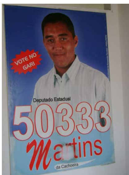
Fig. 14 Cartaz do sujeito B como candidato nas últimas eleições

Um dado visual importante foi revelado na casa do sujeito B. Trata-se da exibição de um cartaz na sala de visita, contendo a sua imagem enquanto candidato a deputado nas eleições do ano de 2006 (Fig. 14, abaixo). Observe-se que o sujeito ainda era chamado de Martins da Cachoeira porque era líder comunitário daquela comunidade.