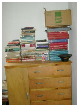
Figs. 11 e 12 Móveis de diferentes cômodos da casa do sujeito B

Após alguns meses, retornando ao local, em agosto de 2007, pude perceber, além da presença do rack na sala, uma estante contendo muitos dos livros que estavam espalhados pelos cômodos da casa no encontro anterior (Fig. 13 abaixo).