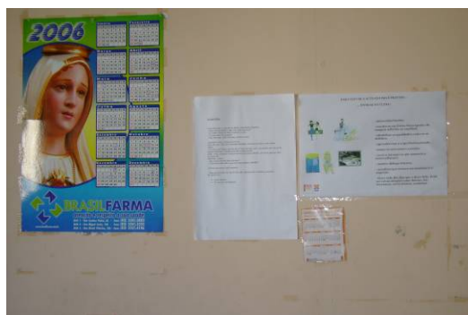
Fig. 5. Parede acima do birô do sujeito A