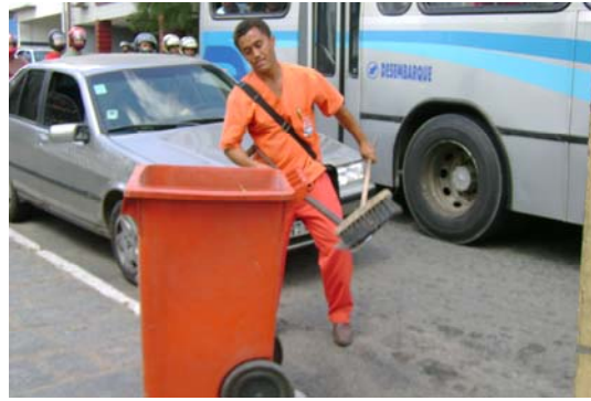
Fig. 2 O sujeito B trabalhando nas ruas

No próximo capítulo, serão apresentados os pressupostos teóricos que fundamentam esta dissertação.